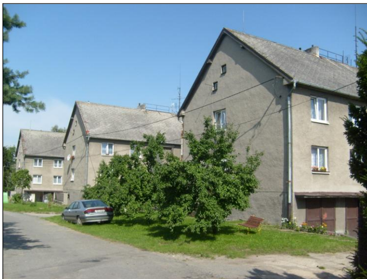
„Bytovky“ v Rusíně