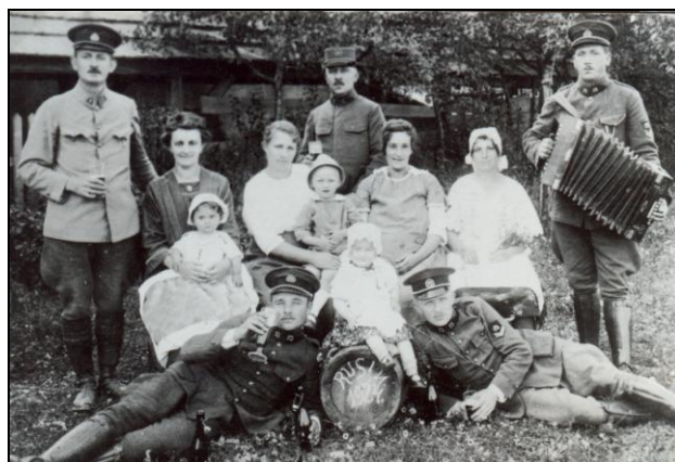
Členové finanční stráže ze stanice Rusín s rodinami v roce 1924