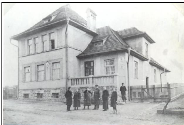
Celnice na konci Rusína u silnice k hranici s Německem, dnes č. 93