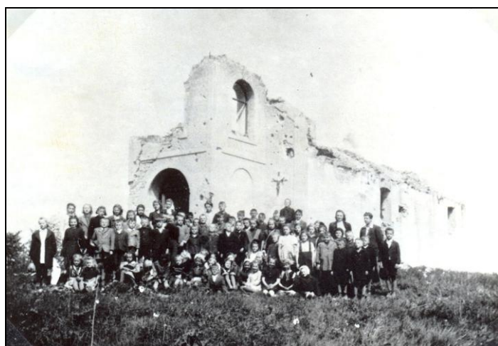
Poničená kaple v roce 1947

V rámci hornoslezské operace Sovětské armády osvobodily v březnu 1945 jednotky 59. armády 1.ukrajinského frontu Rusín a okolní vesnice. V bojích bylo mnoho domů a hospodářských budov zničeno. Těžce byla poškozena i kaple Navštívení P.Marie, která byla známým poutním místem.