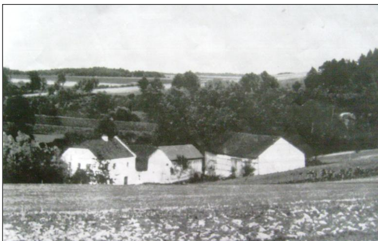
Bývalý větrný rusínský mlýn

Větrný mlýn, stojící kdysi za dnešním fotbalovým hřištěm, neexistuje. Před 2.světovou válkou byl zde mlynářem Emil Fucks.