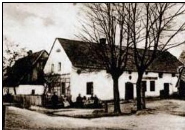
Bývalý Jaitnerův hostinec a c. k. celní úřad v Rusíně, dnes č. 87

Češi, vyskytující se v Rusíně, byli jen příslušníky finanční stráže na celnici, která byla na hranici s Německem zřízena rakousko-uherským mocnářstvem v roce 1887.