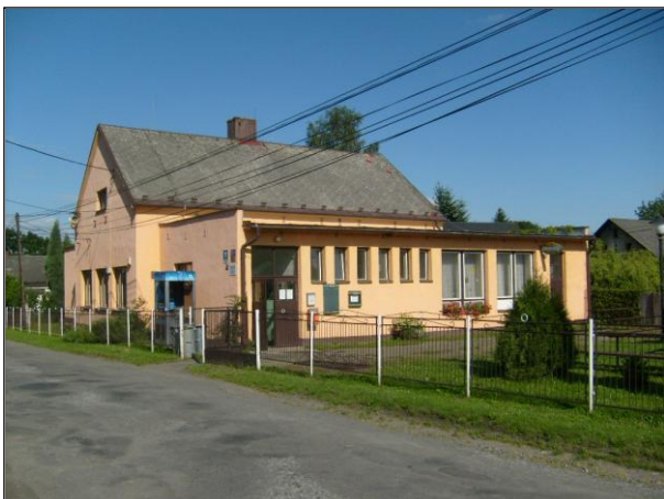
Bývalá obecná škola v Rusíně, dnes obecní úřad

V roce 1980 má středisková obec 246 obyvatel, obývají 89 domů. V roce 1991 je pro Rusín uváděno 31 trvale obydlených domů a 10 objektů individuální rekreace. V roce 2000 má Rusín 119 obyvatel. Od roku 2003 má Rusín nové obecní symboly – erb a vlajku.