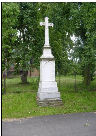
Kříž uprostřed vesnice

Některé rusínské obnovené a opravené kříže: