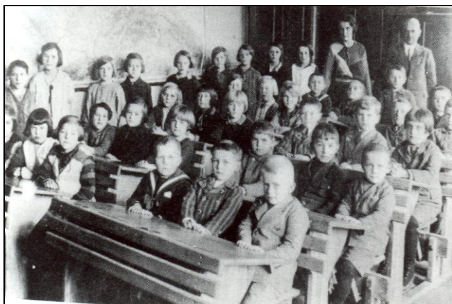
Žáci obecné školy v Rusíně, ročníky narození 1923-1926

Zpočátku chodily rusínské děti do školy v Hrozové, protože až v roce 1787 byla vyslyšena žádost Rusína k zřízení vlastní školy. Než byla postavena školní budova učilo se údajně v budově č. 13. První školní budova z roku 1798 byla pokryta slámou, břídlicí byla pokryta až kolem roku 1850.