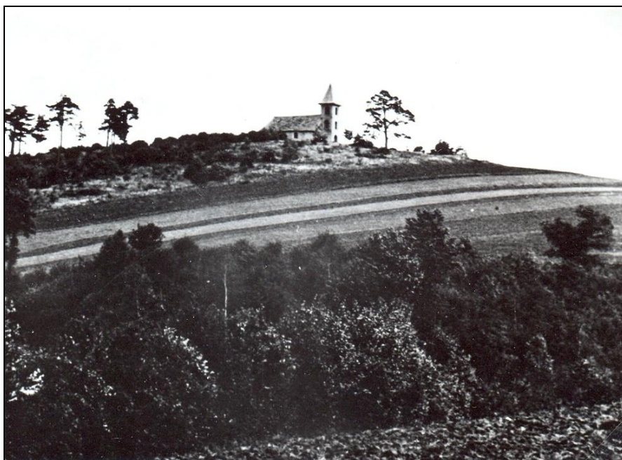
Kaple v 30. letech 20. stol.