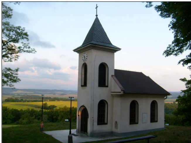
Od kaple je nádherný výhled do kraje

Na obou bočních zdech je umístěna malá křížová cesta. K výzdobě interiéru dále patří obraz „Setkání Marie s Alžbětou“, socha Panny Marie s Ježíškem a socha patronky Slezska sv.Hedviky. Dále je zde u vchodu latinsky psaný pamětní list o vysvěcení křížové cesty, souhlas k benedikci kaple a pamětní list k vysvěcení kaple s česko-německým textem.