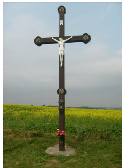
Kříž u cesty k polské hranici