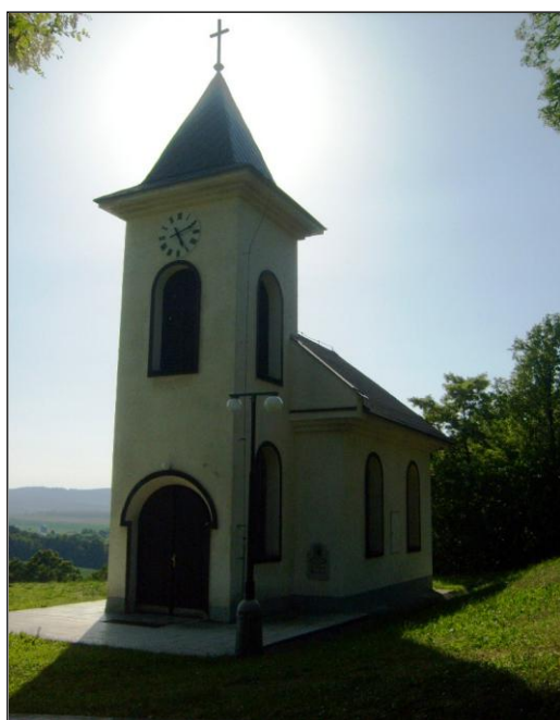
Dnešní rusínská kaple

Jedinou politickou stranou v obci je v roce 1966 KSČ, která má 6 členů. V roce 1980 má 15 členů. V roce 1990 se místní organizace strany rozpadla stejně jako celá Národní fronta.