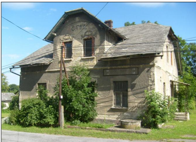
Bývalý „hotel“ v Rusíně, dnes č. 85