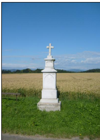
Kříž u cesty do Matějovic