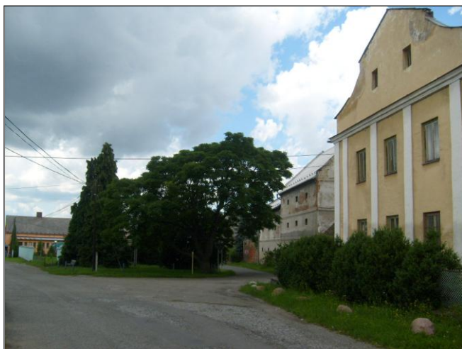
Střed obce s budovami bývalého kanovníckého, do roku 1945 Peschkeova, potom státního, dnes Říhova statku

Každoročně se zde koná pouť s mezinárodní účastí, zpravidla vždy v první neděli v měsíci srpnu. Rok od roku přichází stále více poutníků